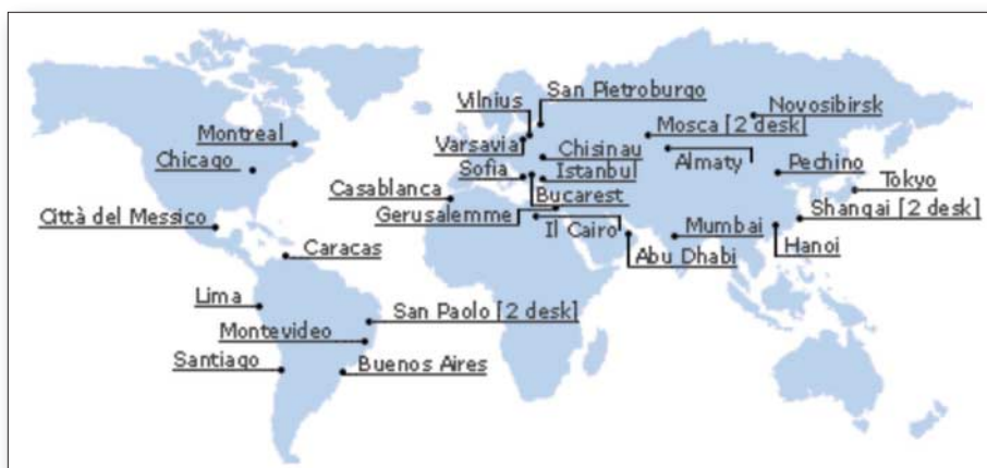
Figura 8 | Lombardia Point estero